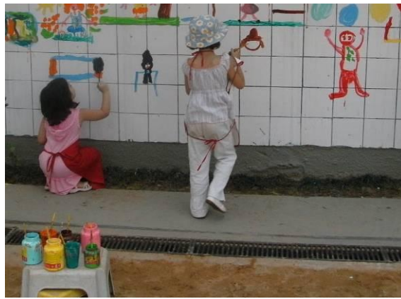
IMAGEM DE COMO REALIZAR A ATIVIDADE:

A sugestão é usar pincel e tinta ou canetinha para a criança desenhar no azulejo ou em uma superfície lisa como por exemplo: mármore, espelho, material plástico, etc. Quando a criança terminar, peço aos responsáveis tirar uma foto do desenho da criança e enviar como registro da atividade (ATIVIDADE DE PORTFÓLIO).